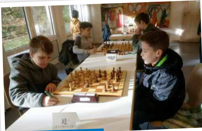
SG Bö./ Lgt – Schwäbisch Hall