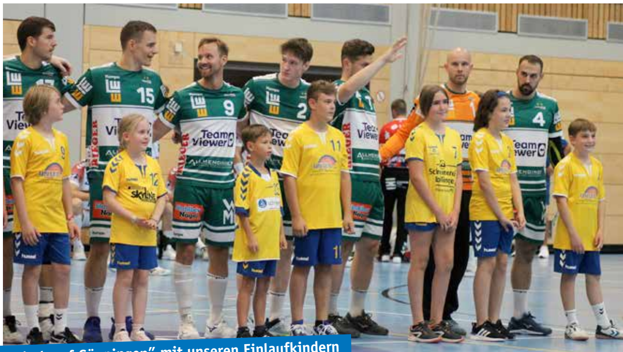
„Frisch auf Göppingen“ mit unseren Einlaufkindern

Auch im Jugendbereich gab es wieder Erfolge zu verzeichnen. Die weibliche C-Jugend wurde Bezirksmeister und die männliche E2 wurde Meister in ihrer Staffel.