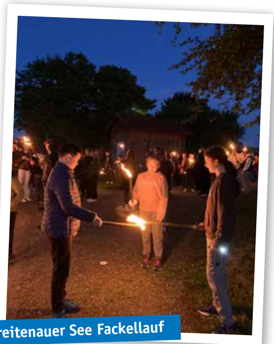
Breitenauer See Fackellauf