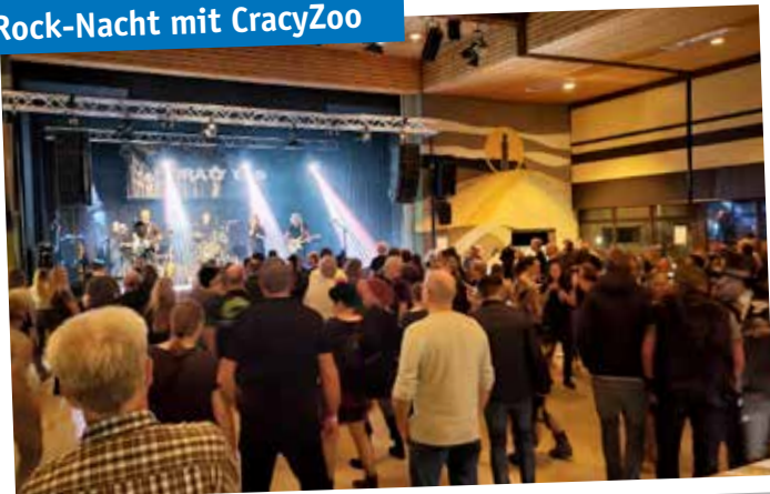
Rock-Nacht mit CrazyZoo