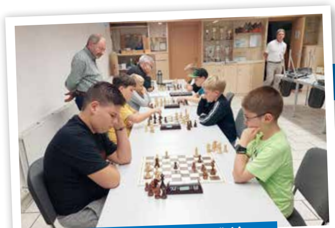
Gemeinsames Jugendtraining mit SV Böckingen

Wer also Lust verspürt, wieder mal ungezwungen eine Runde Schach zu spielen, ist recht herzlich eingeladen, unverbindlich bei uns herein zu schnuppern. Wir freuen uns darauf.