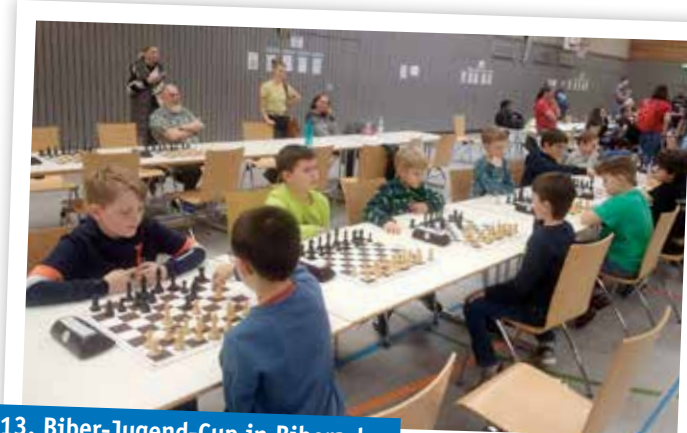
13. Biber-Jugend-Cup in Biberach

Die praktischen Spielkenntnisse können auf offenen Jugendturnieren getestet werden.