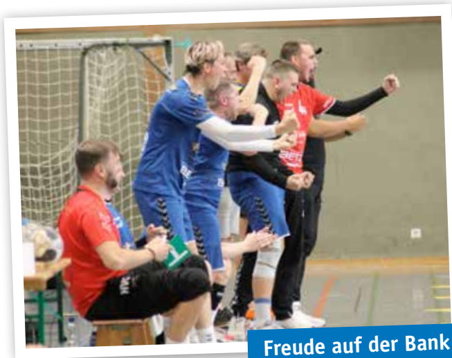
Freude auf der Bank